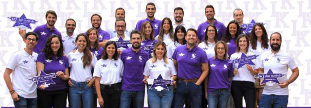
Ganadores ST Star Agency Western Europe de las últimas 4 ediciones

Language Kingdom vuelve a estar nominada al premio ST Star Agency Western Europe , el mayor reconocimiento mundial en nuestro sector.