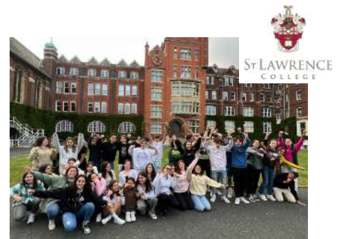
ST LAWRENCE COLLEGE