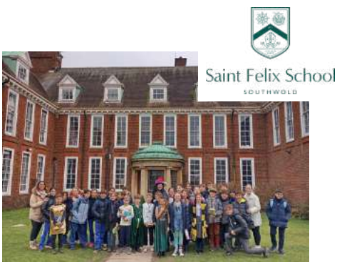
ST FELIX SCHOOL