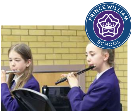
PRINCE WILLIAM SCHOOL