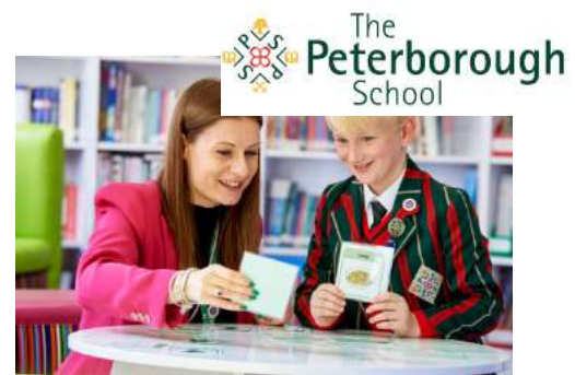
THE PETERBOROUGH SCHOOL